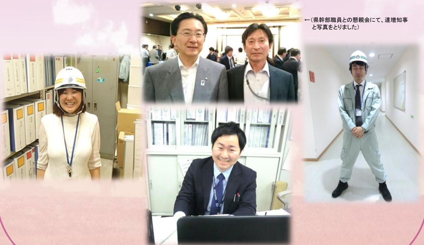
←(県幹部職員との懇親会にて、達増知事と写真を撮りました)