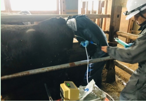
高能力雌牛飼養農家牛舎での採卵風景

昨年度に引き続き、今年度も採卵を行っていきますので、対象牛に選ばれた際にはご協力いただきますよう宜しくお願いいたします。