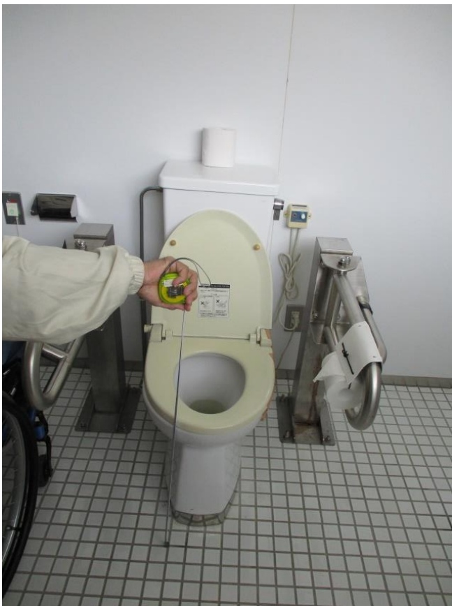
障がい者用トイレ