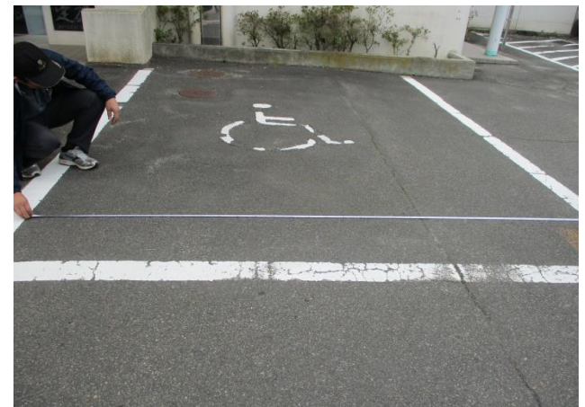
車いす使用者用駐車施設