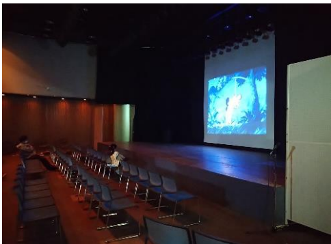
おでってホールは、さながら映画館

年3回夏冬春の長期休みに合わせて開催。「映画館での映画はちょっとハードルが高くて…」という親子連れの方にも好評でした。これもボランティアさんのおかげです。