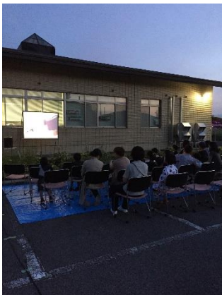
上映する映画の中にはおばけのお話も…。雰囲気たっぷりです。