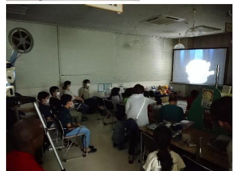
たくさんのお客様。皆さん楽しみにしていました。