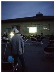
レンズの灯りに虫が寄ってきて、影が映し出されることも！上映を見守ります。