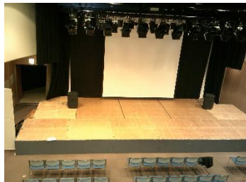
映写室からホールを望む