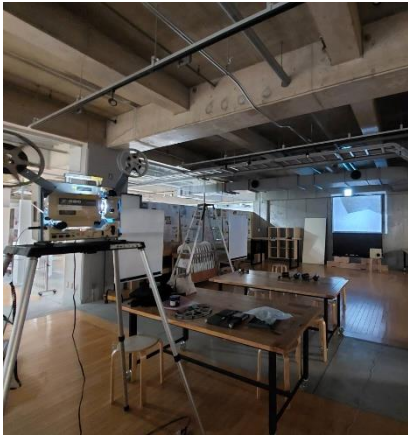
初めての会場は下見が大切