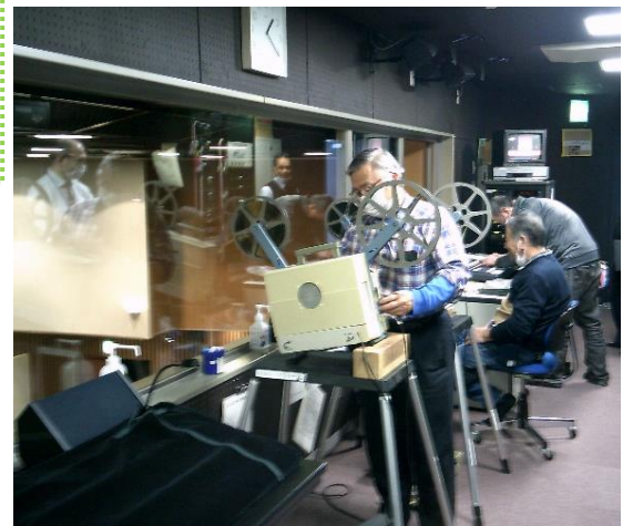
おでって映写室 (音響はおでってサポーターさん)