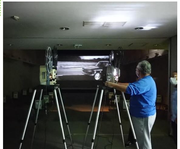
上映開始 —— 「県政ニュース (シネスコ)」