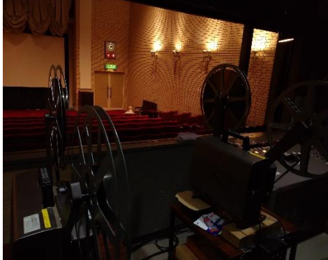
映写室から講堂を望む