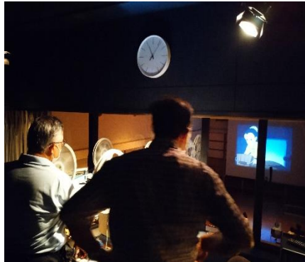
映写室から上映を見守る