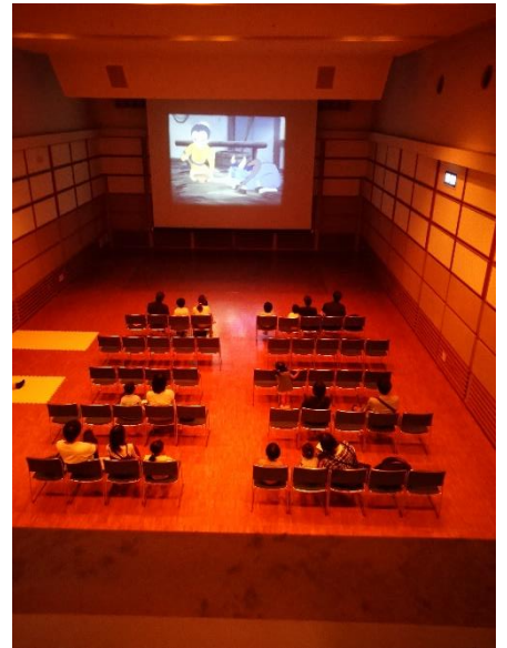
大きいスクリーンに、皆さんしばし“くぎ付け”です