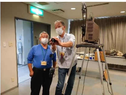
ボランティアさん同士で相談しながら…