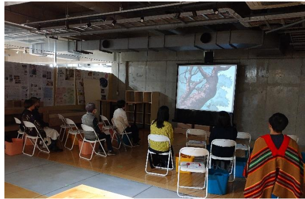
この日は急遽、映写機をテーブルに置いて上映。上映後、映写機に興味津々のお客様方が自然に周りに集まり、ボランティアさんとの素敵なコミュニケーションの時間となりました…。