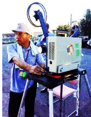
明るいうちから準備開始