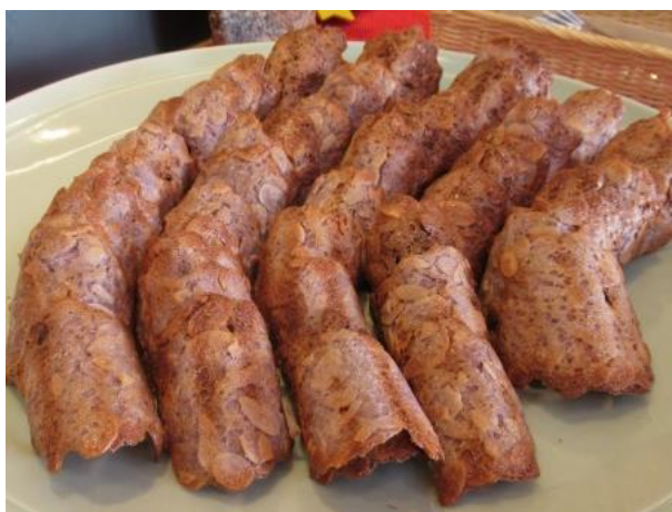
「山ぶどう（野田村産）と、 アーモンドのクッキー」