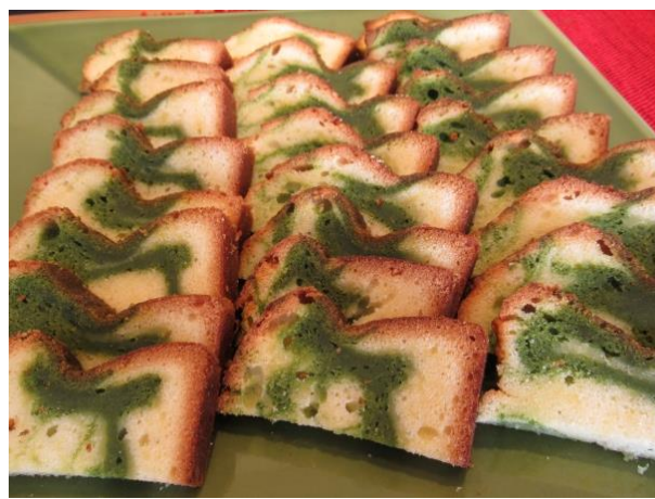
「寒じめほうれんそう（普代村産）の パウンドケーキ」