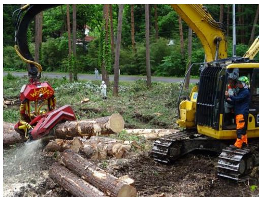
(高性能林業機械等操作体験)