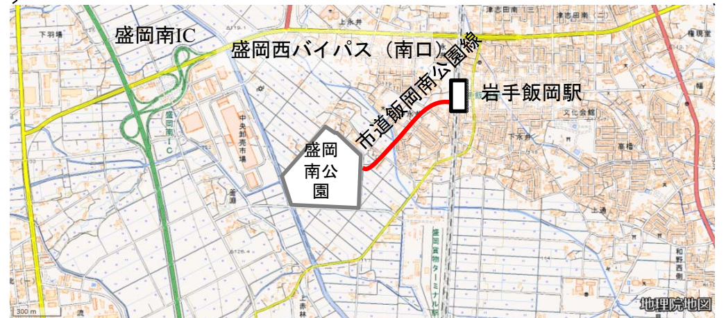
盛岡南公園位置図