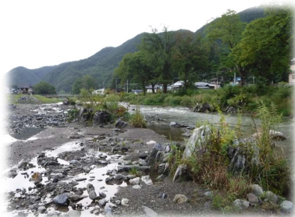
産直箇所における水際の岩の存置