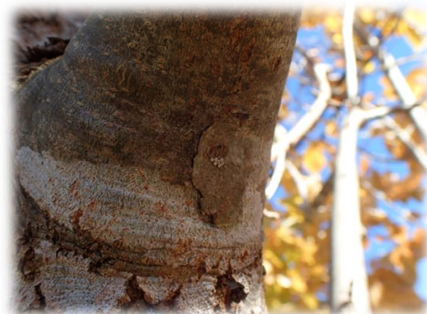
チョウセンアカシジミの卵の移植