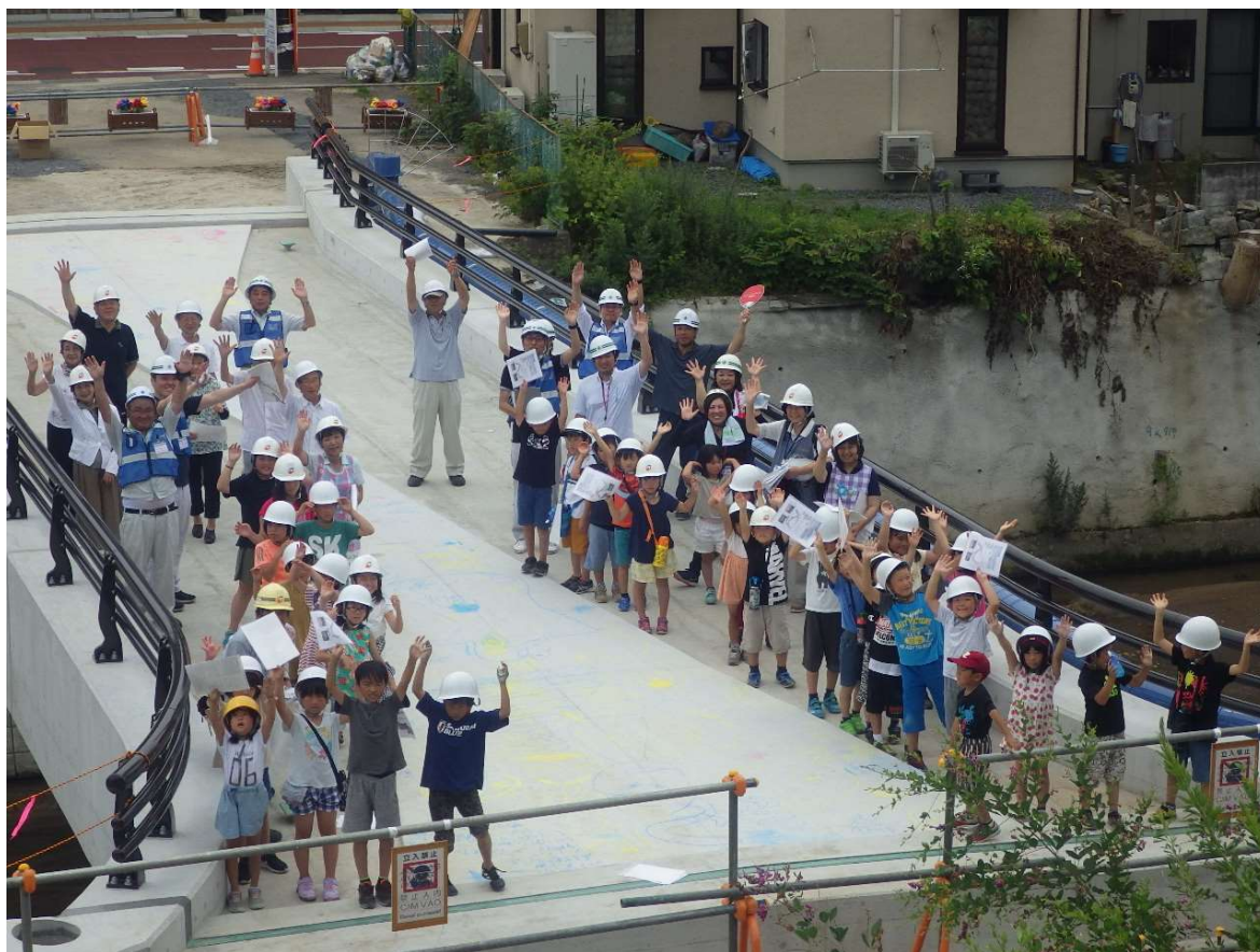
参加者全員で集合写真

このことから、事業の進捗状況を公開することで更なるご理解をいただけるよう、令和元年7月30日（火）に、周辺住民の方々を対象とした現場見学会を開催しました。