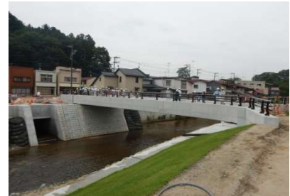
新橋から事業進捗を展望