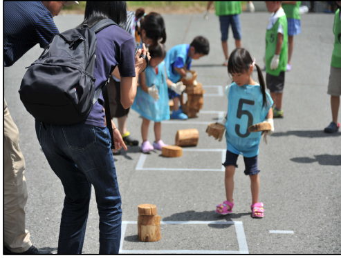
気仙スギ積み木競争

各イベントとも、たくさんの方々が訪れました。中でも気仙スギ積み木競争では、自分の背丈近くまで積上げる子もいて、大いに会場を沸かせていました。