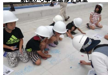
記念として手形等を書いてもらいました