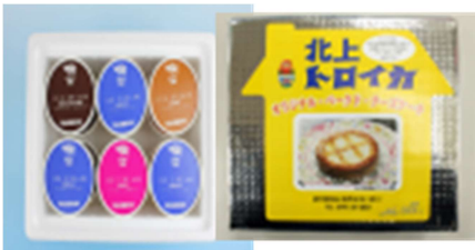
Bakeドチーズケーキ・安比高原アイスクリーム セット