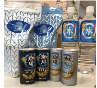
岩泉ヨーグルト、龍泉洞の水・珈琲セット