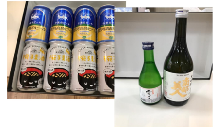
地酒・地ビールセット (南部美人、雪っこ、銀河高原ビール)