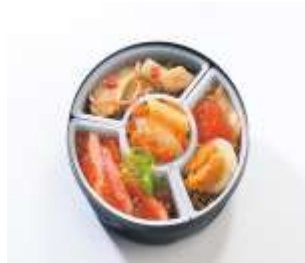
黄金四宝漬 350g・海鮮グラタン セット