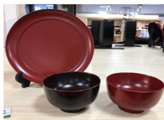
浄法寺塗 お碗2客・盛皿8寸セット