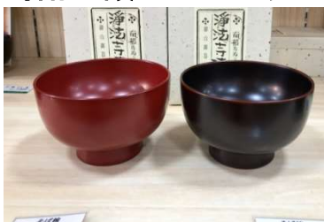
浄法寺塗 そば碗セット(朱・溜)各1客