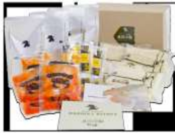
盛岡冷麺4食ギフト