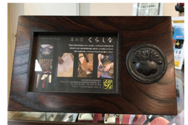
岩谷堂くらしな 写真たて