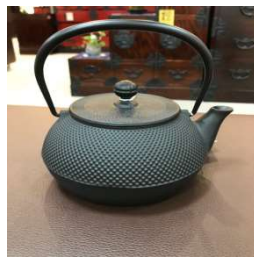
南部鉄瓶 7型アラレ