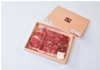
岩手短角牛肩肉焼肉用 500g・ 短角牛ハンバーグ 150g×8セット