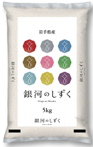
県産米「銀河のしずく」5kg