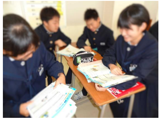
初見の文を読み合う様子

などを行った。わからないところを素直に聞くことができ教え合う姿が多く見られた。また、役割を与えられることで、意欲的に音読等に取り組む姿が見られるようになった。