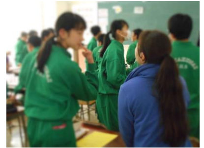
他教科の教員も生徒として授業に参加