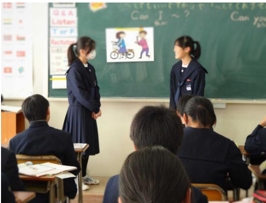
Basic Dialog 暗唱の様子

※振り返りシートの裏に発表の評価をつけた。真似したい生徒の名を書かせ、次時に紹介するなどし、発表への意欲付けに役立てた。