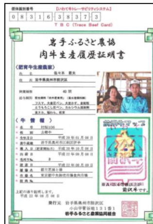
(いわて牛トレーサビリティシステムホームページ http://www.iwategyu-tbc.jp/ )