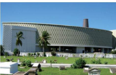
アチェ津波博物館の外観

伝承館では、今後も国内のみならずアチェ津波博物館を始めとする海外の施設とも連携し、東日本大震災津波の事実と教訓の伝承に取り組んでいきます。