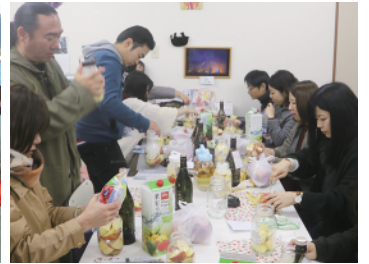
左：海中熟成酒水揚げの様子 右：果実酒づくり体験の様子