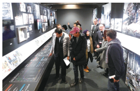
伝承館の館内を視察する関係者