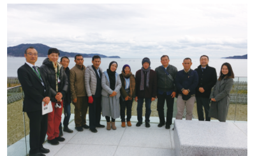
視察に参加した両館の関係者