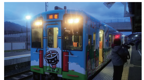
津軽石駅を発車する始発列車

東日本大震災津波からの復興のシンボルであり、地域の方々の生活の足としてだけでなく、観光面でも大きな役割を果たしてきた三陸鉄道の一日も早い全線運行再開が望まれています。