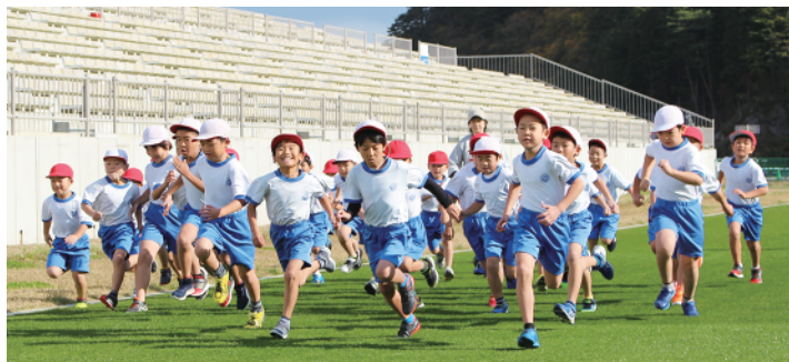
元気いっぱいに走る児童

当日は青空の下、低・中・高学年のコースに分かれ、児童たちは応援に駆け付けた保護者らの声援を受けながら元気いっぱい走り、広がる芝生が待ち受けるスタジアムのゴールを目指しました。