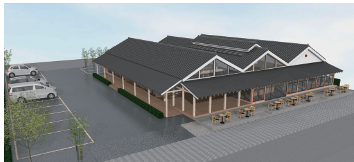
「発酵パーク CAMOCY」の完成予想図

また、近隣には、復元される歴史的建造物「吉田家住宅(大庄屋屋敷)」と味噌工場が整備される予定で、東日本大震災津波で甚大な被害を受けた同地区の再生とにぎわい創出を図ります。