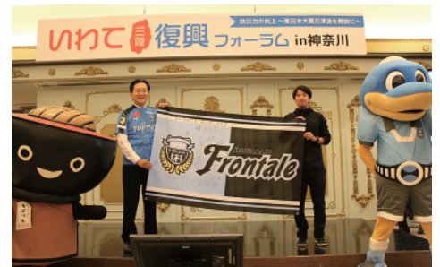
川崎フロンターレメッセージフラッグ贈呈