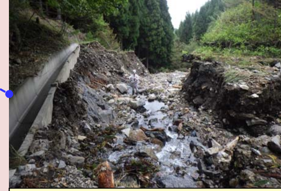
林道の路体流出[釜石市]