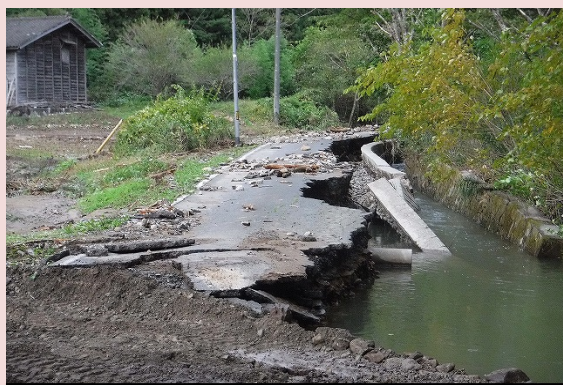
林道の路体流出[山田町]