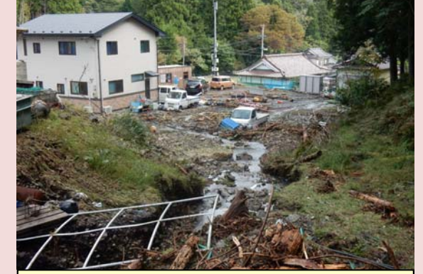
溪流からの土砂流出[釜石市]