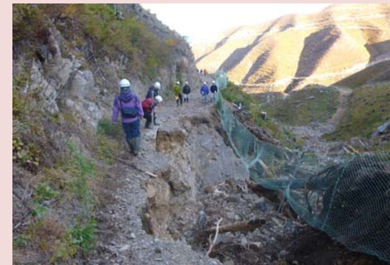
作業道の路肩決壊[釜石市]