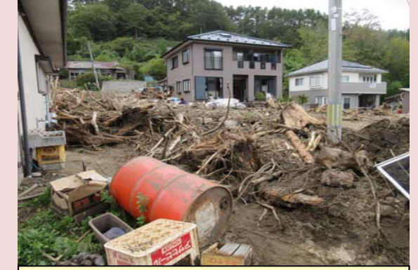
溪流からの土砂流出[普代村]