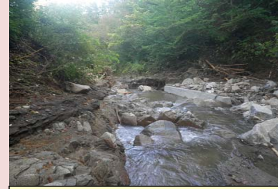
林道の路体流出[普代村]