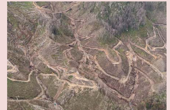
造林地の崩壊[釜石市]