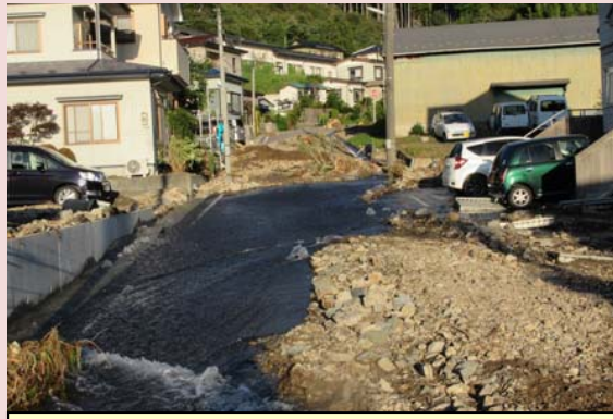
溪流からの土砂流出[山田町]