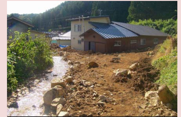
溪流からの土砂流出[宮古市]