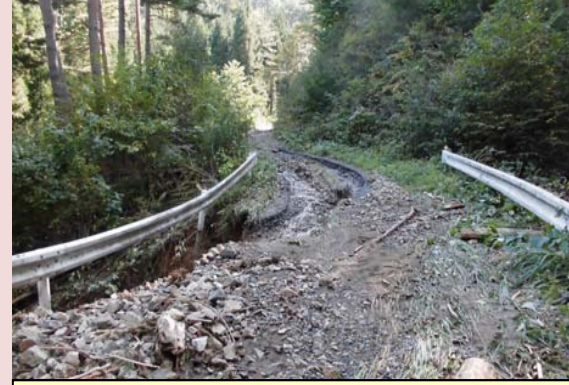
林道の路肩決壊[岩泉町]