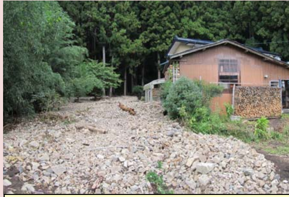
溪流からの土砂流出[岩泉町]