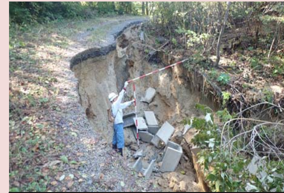
林道の路肩決壊[宮古市]