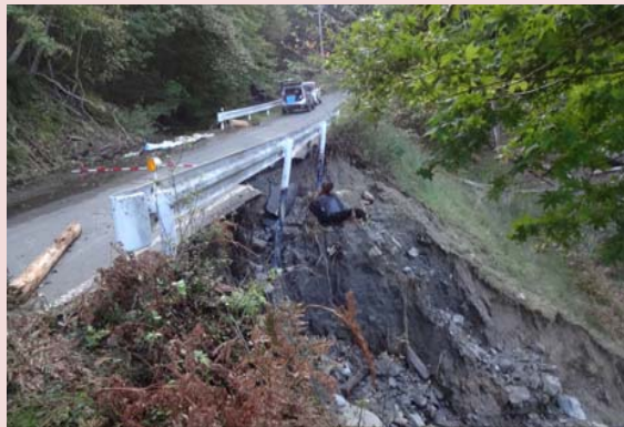
林道の路肩決壊[大船渡市]