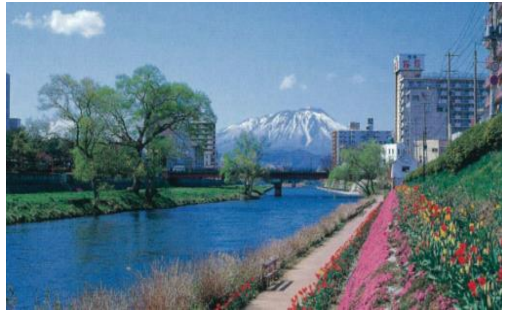
松尾鉱山閉山後、坑廃水によって「死の川」と呼ばれた北上川が清らかな流れを取り戻すまでをお伝えします。