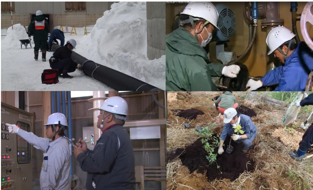
24時間365日、関係機関のたゆまぬ努力により北上川の清流が守られていることをさまざまな事例を交えてお伝えします。