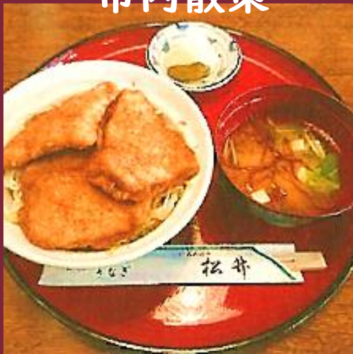
例:松竹ソースかつ丼