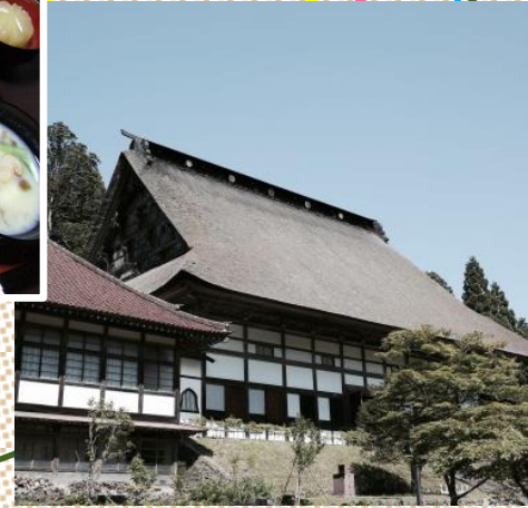
日本最大級の茅葺屋根