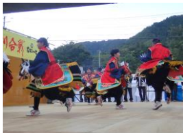
角浜駒踊り保存会 (洋野町)