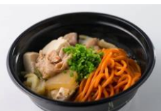
岩手町ブース (肉のふがね 北のほる麺)