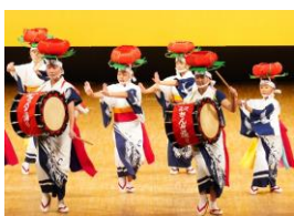
滝沢市さんさ踊り保存会