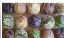
一戸町ブース (いちのへびより 地産地消マフィン・ コーヒー)

※二戸市ブース(よりゃんせ金田ー てんぼ)、 久慈市ブース(短角牛まん母ちゃん) も出店