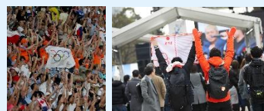
過去大会のライブサイト・競技会場での観戦の様子（イメージ）