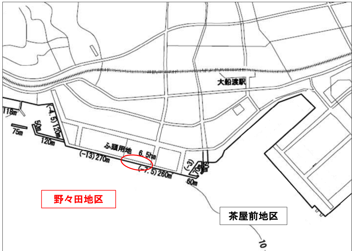
大船渡港港湾計画位置図