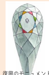
復興のモニュメント