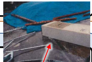
建物解体時にフロン類の回収がされず放置されている業務用エアコン

回収率向上のため、 関係者が相互に確認・連携し、ユーザーによる機器の廃棄時のフロン類の回収が確実にされる仕組みへ。