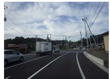
②一般国道340号 長興寺工区 (R.元.9月開通)