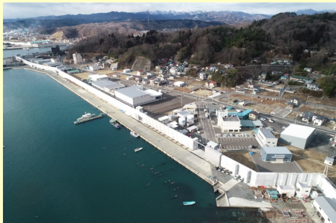
宮古港海岸(鉾ヶ崎)(宮古市):令和元年9月整備完了

また、津波発生時に現地で人が操作することなく、水門・陸閘を安全かつ迅速・確実に閉鎖できる「水門・陸閘自動閉鎖システム」の整備を進めており、整備が完了した箇所から順次運用しています。