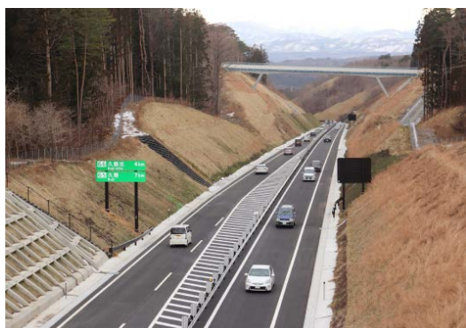
開通後の状況①

引き続き、国や市町村、関係者の皆様と連携し復興道路の早期の全線開通に向けて全力で取り組んでいきます。