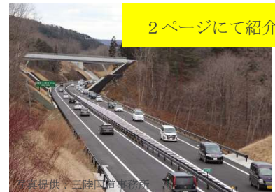
①三陸沿岸道路 久慈北IC～侍浜IC (R.2.3月開通)