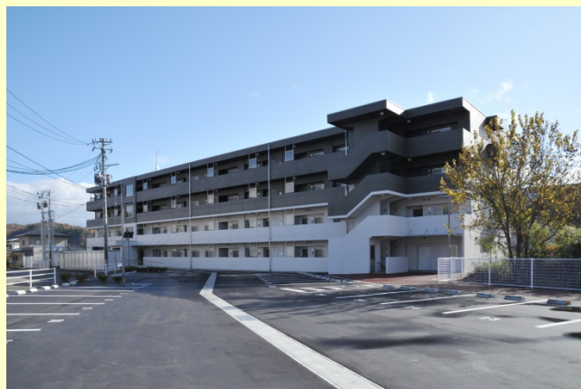
県営黒沢尻アパート(北上市):令和元年11月完成