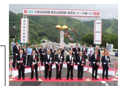
④三陸沿岸道路 釜石山田道路 釜石北IC～大槌IC (R.元.6月開通)