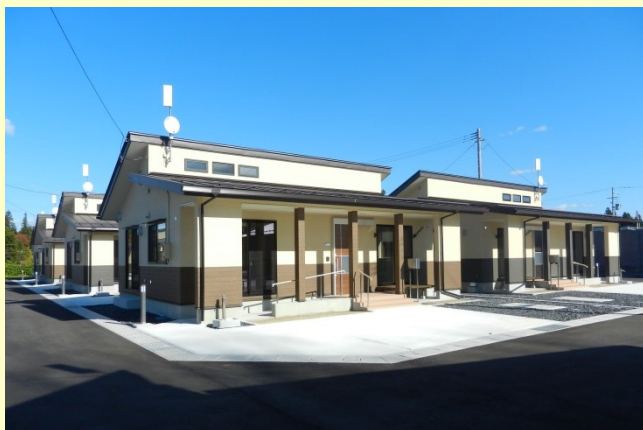
県営構井田アパート(一関市):令和元年8月完成

内陸部の災害公営住宅は、稲荷下(遠野市)、構井田(一関市)及び黒沢尻(北上市)で完成し、全体の約7割が完成しました。残る南青山(盛岡市)は、令和2年度の完成を予定しています。