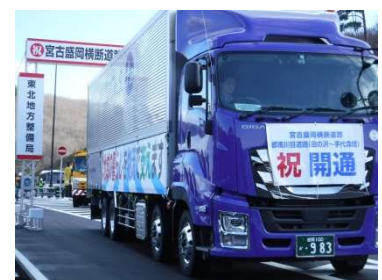
③宮古盛岡横断道路 都南川目道路 田の沢IC～手代森IC (R.元.12月開通)