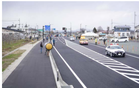
開通後の状況②