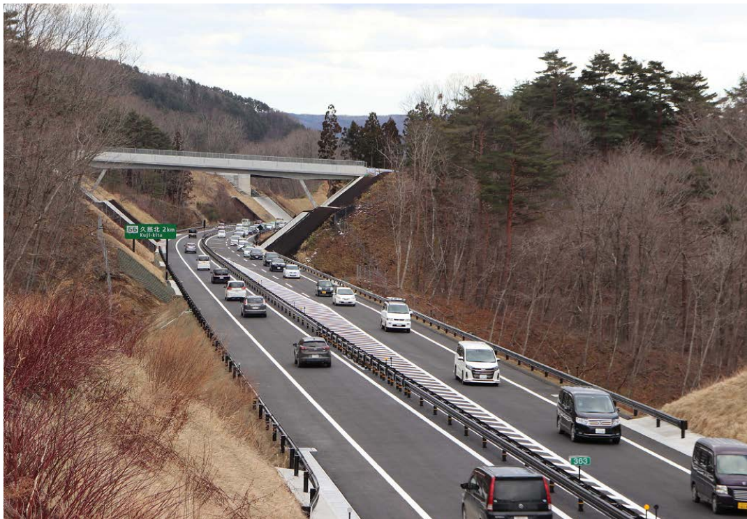
開通後の状況

今回の開通により、震災前に開通していた久慈道路と合わせて約11kmが自動車専用道路でつながり、洋野町から県立久慈病院への救急搬送時間の短縮や周遊型観光の活性化等、県民の安全・安心な暮らしや産業・観光振興の効果が期待されるとともに、道路ネットワークの信頼性が大きく向上します。