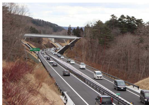
開通後の状況②