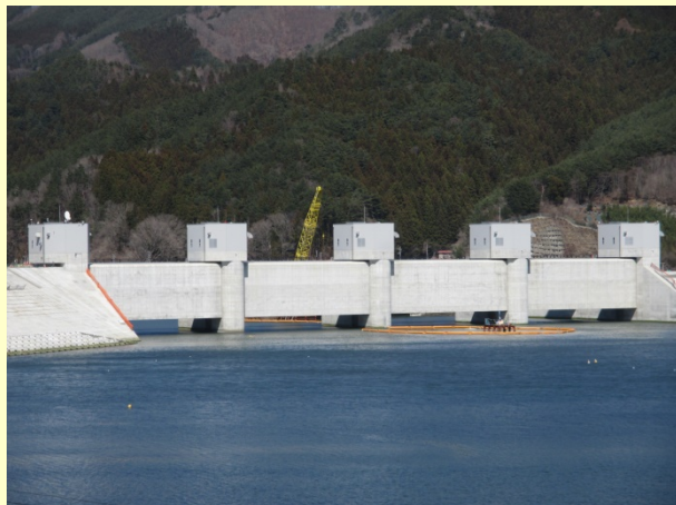
大槌川(大槌町):令和2年2月整備完了