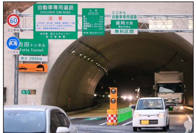
開通後の状況②