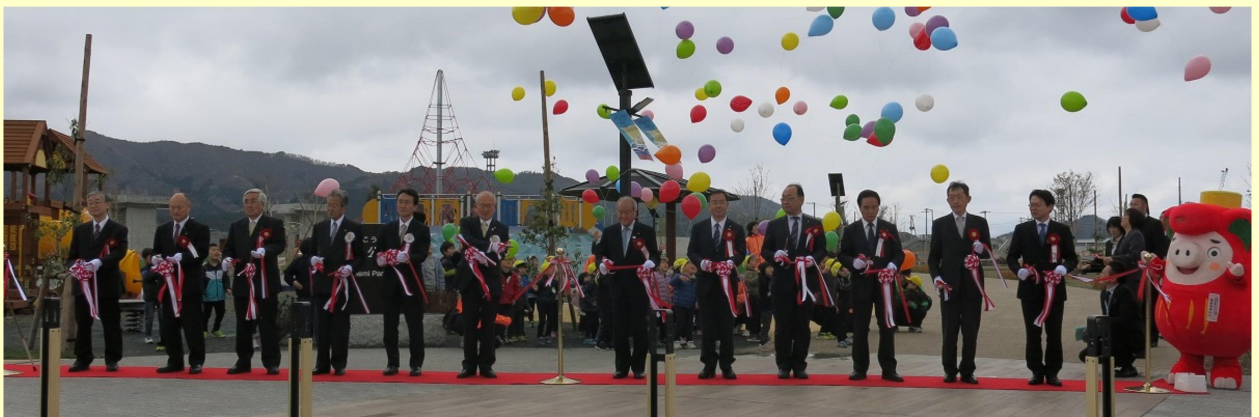
大船渡駅周辺地区土地区画整理事業竣工式におけるテープカットの様子（夢海公園において）