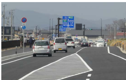
開通後の状況①

※開通式が予定されていましたが、新型コロナウイルスの感染拡大を防ぐため、開通式は中止となりました。