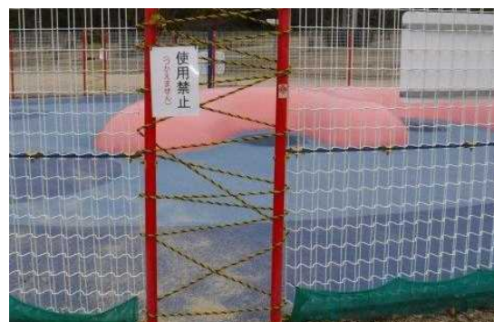
立入禁止措置状況