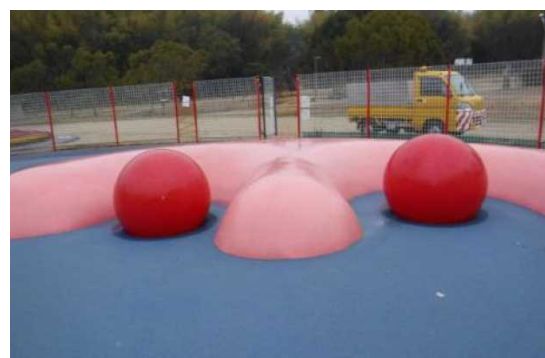
ボール（φ850）設置時の状況