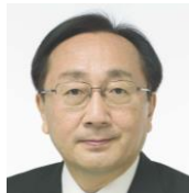
いわてけんちじ 岩手県知事 たつそ たくや 達増 拓也