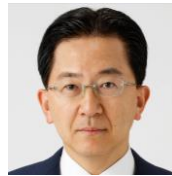
みやぎけんちじ 宮城県知事 むらい よしひろ 村井 嘉浩