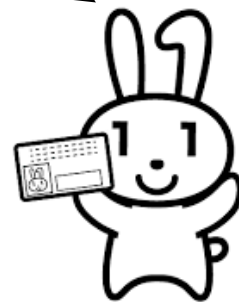
マイナンバーキャラクター マイナちゃん