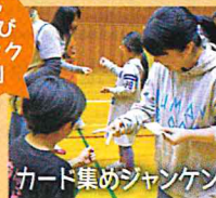
カード集めジャンケン