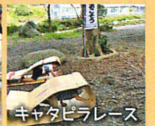
キャタピラレース