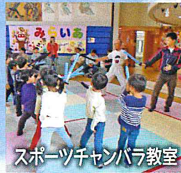
スポーツチャンバラ教室