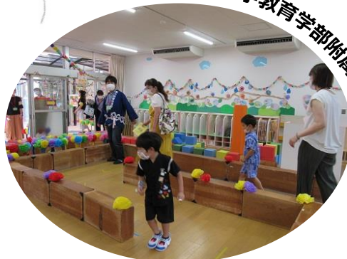
愛媛大学教育学部附属幼稚園

「夜のつどい」を「夏のつどい」に変更し、全体を2グループに分けた分散型にし、年長児発案の店やPTAのコーナー、盆踊りを中心に行いました。花火や飲食は中止しましたが、年長児の店のスペースを広くとったり積み木迷路を一方通行にして密を避けたりして、親子で楽しめるようにしました。