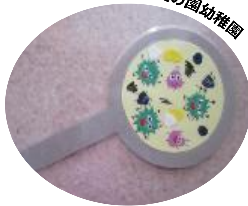
武庫愛の園幼稚園

虫眼鏡のイラストを使って、手洗い前には雑菌やウイルスがいることを見せることで、幼児の手洗いや消毒への意欲を高めました。