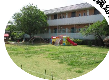
鳥取大学附属幼稚園

園庭で走ったり、三輪車やスクーターに乗って遊んだりすることがより楽しくなるように、芝生やクローバーを刈り、迷路を作りました。