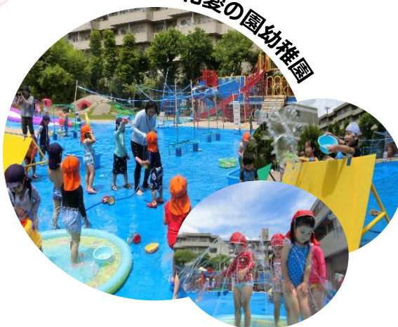
立花愛の園幼稚園

ダイナミックな水遊びの展開のため、グラウンド全体を『ウォーターパーク』へと大改造しました。サバイバル水鉄砲、噴水コーナー、ウォーターライダー、水路作り、水のトンネルコーナーなどを展開し、密を避けつつ、幼児が伸び伸びと遊べるようにしました。