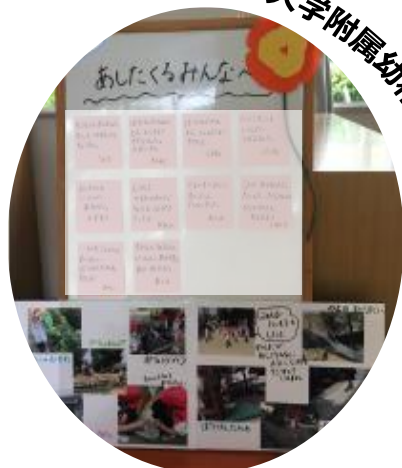
神戸大学附属幼稚園

隔日登園の中、別の登園日の幼児との仲間意識や遊びの共有のため、「あしたくるみんなへ」活動を実施しました。掲示版に、今日の遊びや楽しかったことなどをかきます。翌日、登園した幼児達は、興味深くそれらを見ていました。同じ遊びを始める幼児もいました。