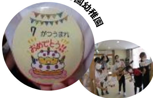
武庫愛の園幼稚園

一斉集合の誕生会は中止し、誕生児はバッジを付けることで、他の幼児がお祝いしやすくしました。また、教職員が給食時にクラスを回ってお祝いパレードを行いました。