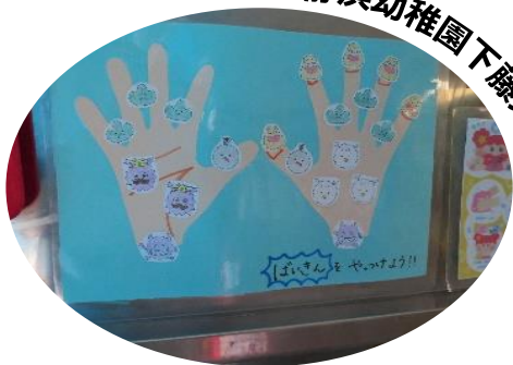
静浜幼稚園下藤分園

手のひらは王様バイキン、指の間はお山バイキン、親指はネジネジバイキン、手首はかけっこバイキンなどを図示し、それぞれこするように、ねじるように、かけっこで手首をつかまえて…など、洗い方が年少児にもわかりやすくなるようにしました。