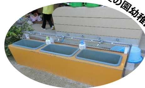
立花愛の園幼稚園

水道使用時の幼児同士の距離を確保 するため、使用できる蛇口を一つおきにし ました。使える蛇口が減ったため、園庭に 手作りで手洗い場を増設しました。