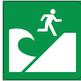
【津波避難場所】 Tsunami Evacuation Area 海啸避难场所 해일 피난 장소 Silungan para sa tsunami Local de refúgio nos casos de tsunami

Tsunami are very fast, dangerous waves that are caused by earthquakes. There have been many deaths due to tsunami in Iwate Prefecture. ● Get away from the ocean and climb to a high place in the following situations: • You are near the ocean and you feel an earthquake (Even a weak earthquake may cause a tsunami) • A tsunami warning 9 or advisory 10 is issued. ● There may be more than one wave, so please do not go near the ocean until the tsunami warning or advisory has been lifted.