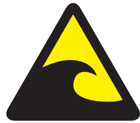
【津波注意】 Caution Tsunami 海啸警戒 해일 주의 Tsunami Warning Cuidado com tsunami