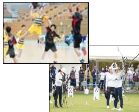
スポーツ大会映像をライブ配信