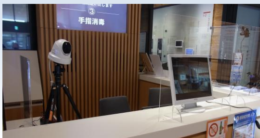
東日本大震災津波伝承館の サーモグラフィーカメラ