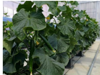
ハウス内で栽培されたきゅうり