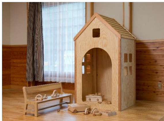
県立病院内保育所への木製玩具等の導入