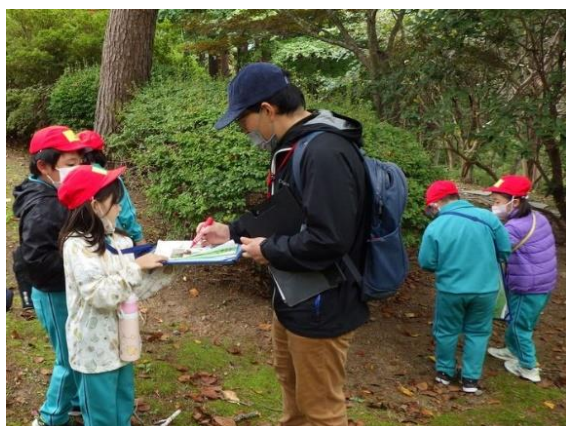
小学生を対象とした森林学習会