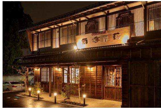
(株)駒木葬祭 本社社屋 (盛岡市)