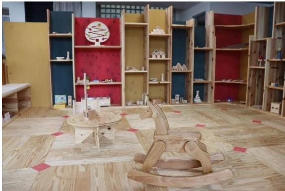
店舗への木育スペースの設置 （トヨタカローラ南岩手(株)）