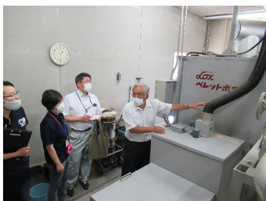
木質バイオマスコーディネーターによる指導