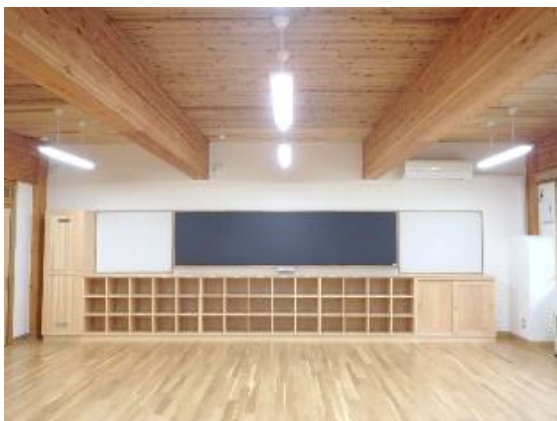
岩手県立伊保内高等学校管理教室棟