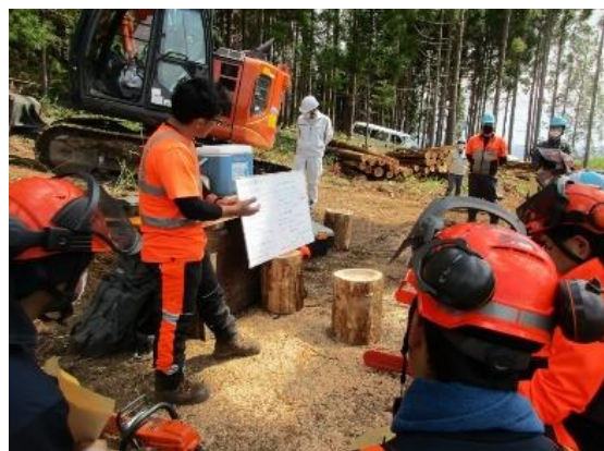
岩手県伐木技術指導員による技術指導