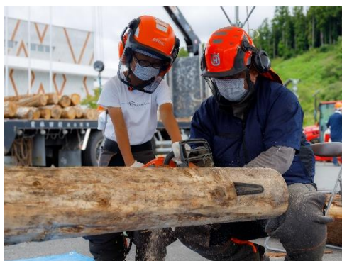
チェーンソー体験

森林の作業の理解を図るチェーンソー体験、林業機械の実演を実施し、気仙地区の小学生約50名が参加しました。