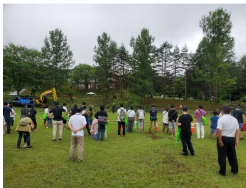
伐倒デモンストレーション