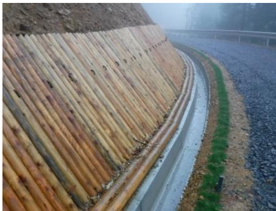
丸太伏工 (森林管理道赤沢線)