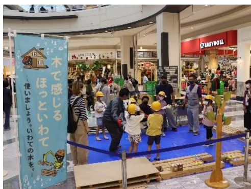
キャッチフレーズによるPR