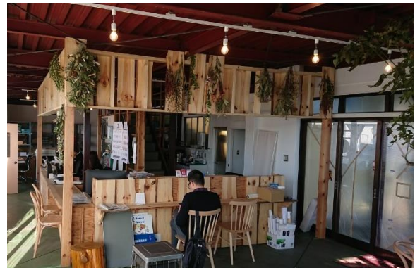
リノベーションによる店舗の内装木質化 （(株)花巻マツダ）