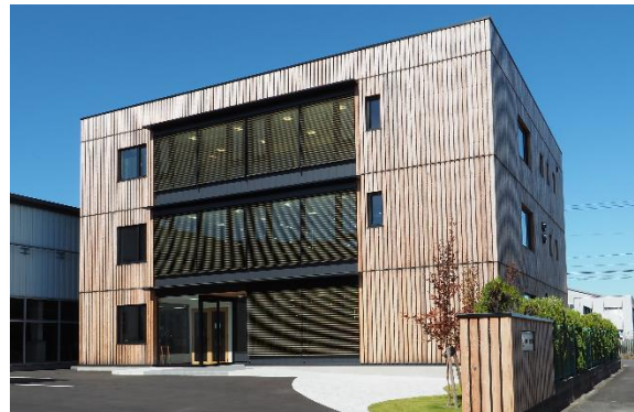
東北住建(株) 本社社屋 (矢巾町)