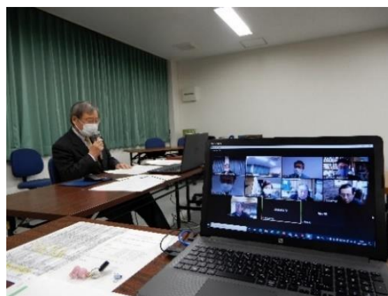
川上～川下の事業者等の意見交換会 (リモート併用)