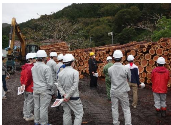
関係団体で構成するサポートチームによる 林業アカデミー研修生の現場研修