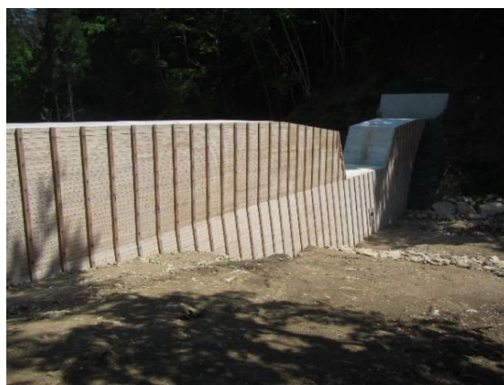
木製パネル式残存型枠（白浜地区復旧治山工事）