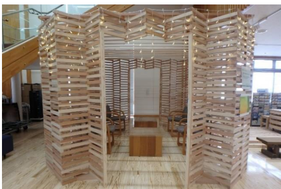
とりのす☆パーテーション