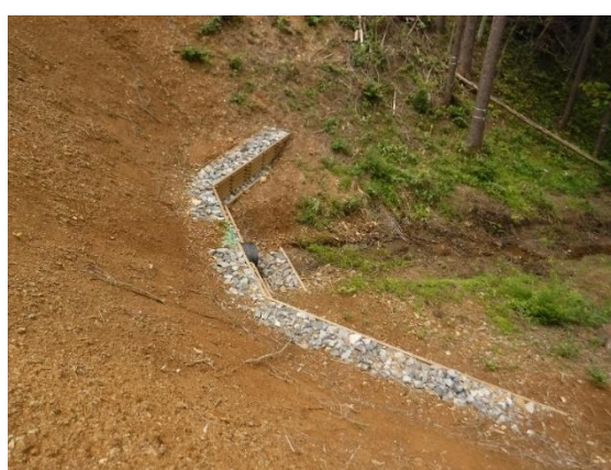
法面を保護する高耐久性木製枠工（盛岡森林管理署）