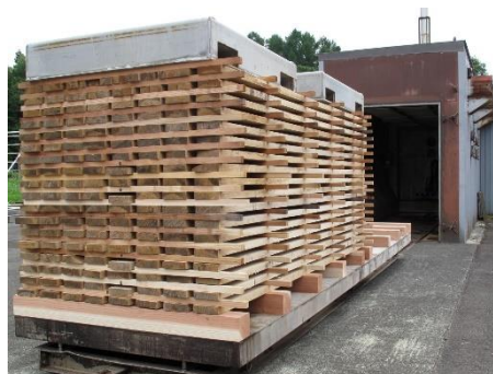
ナラ板材の人工乾燥