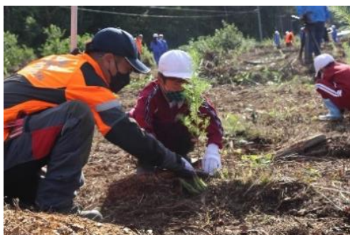
地元林業関係団体の方から指導を受けながら植林する児童

洋野町教育委員会では、平成27年から町独自の教科である「海洋科」の実践を町内小中学校に広げており、その一環で、小学生が植林体験をとおして森と海との密接な関係を学ぶ取り組みを行っています。