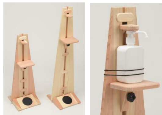
クラフトマンスタンド (足踏み式消毒液スタンド)