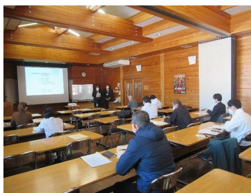
木質バイオマス利用地域サポーターのフォローアップ研修