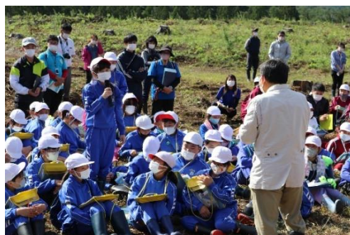
ひろのまきば天文台長に森と海のつながりについて質問する児童