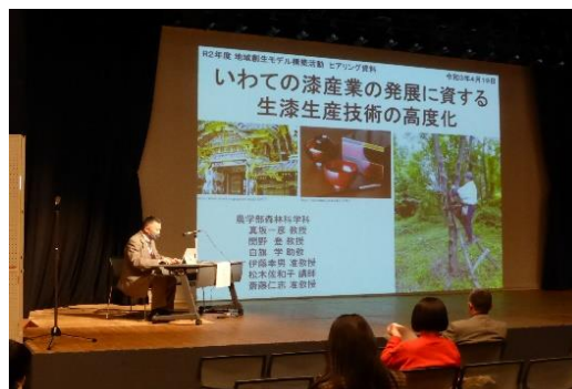
生漆生産技術の研究発表