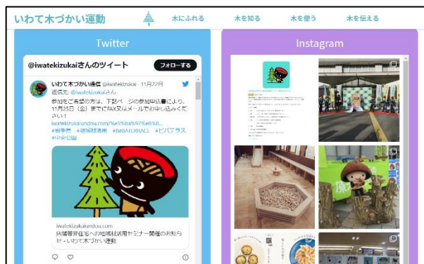
Twitter等を活用した情報発信