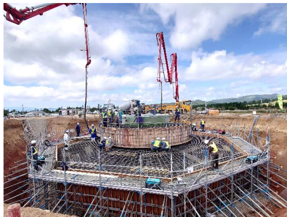
風車基礎型枠 (稲庭高原風力発電所再開発事業)