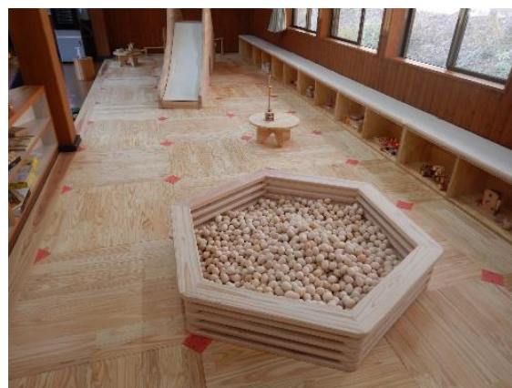
大窪山森林公園に設置した木育スペース