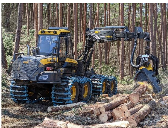
高性能林業機械（ハーベスタ）