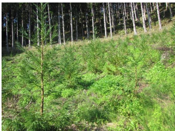
再生林施工地(スギ)