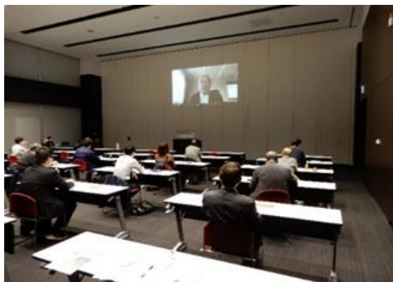
建築士等を対象とした研修会の開催

また、建築士や工務店等のデザインや設計、施工に従事する技術者等を対象とした、経済的かつ魅力的な中大規模木造建築物を建築するための設計手法と実例についての研修会や、本県における木造建築の推進を図るためのシンポジウムの開催など、岩手県建築士事務所協会と連携し、木造建築に携わる人材の育成に取り組んでいます。