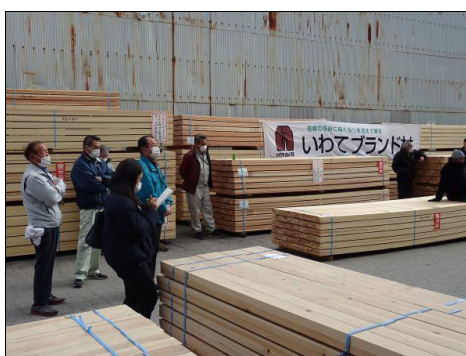
ブランド材会場の様子

また、「ウッドショック」の影響で発生した外材から国産材への代替需要等について、市場関係者と情報交換を行いました。