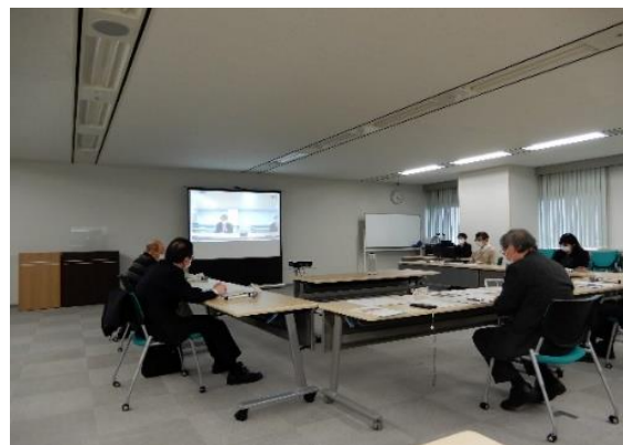
岩手の木造建築推進シンポジウム (リモート併用)