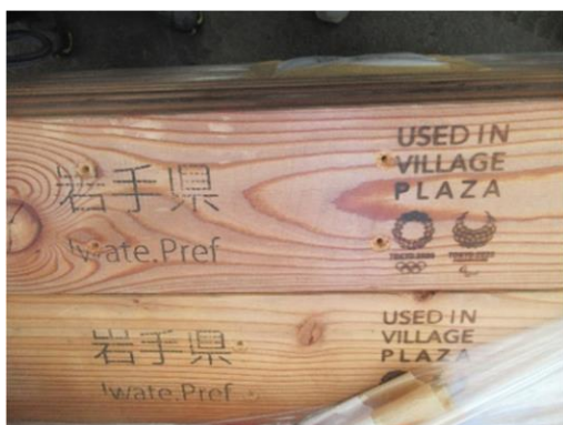
東京2020大会選手村施設で使用し、返却された県産木材