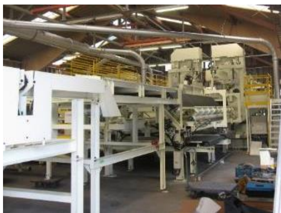
補助事業により導入した製材機