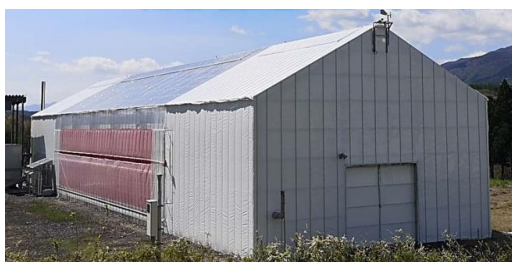
環境制御ハウス（外観）

空調設備の一つとして、県内企業が製造する木質チップボイラー（100kW）1台を導入し、県産の燃料材を使用することによる暖房費の低コスト化を検証しています。