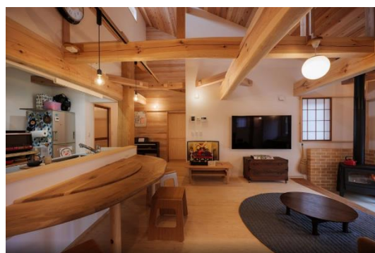
構造材や内装に県産木材を利用した住宅