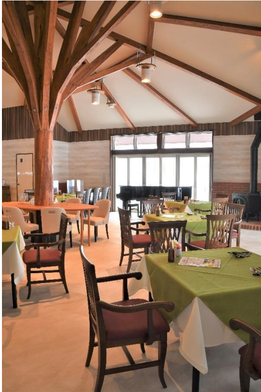
産直ハウスくずまき高原 レストラン棟 (葛巻町)