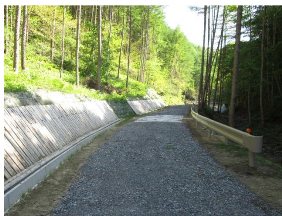
森林管理道（三田貝線）