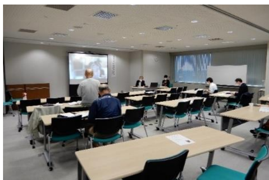
建築士等を対象とした研修会の開催