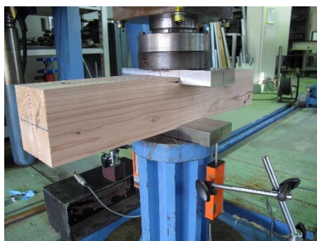
スギ赤身土台のめり込み試験