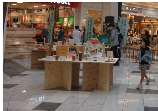
「いわて木づかい展示会」の様子