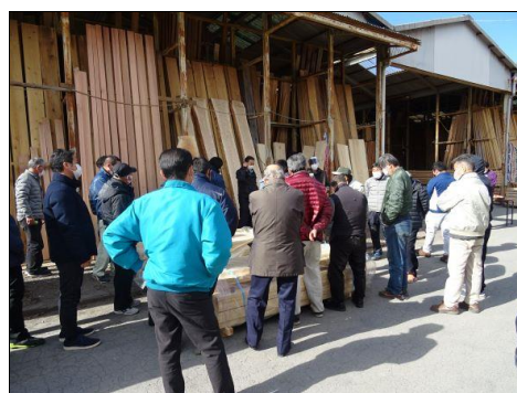
ブランド材会場でのセリの様子