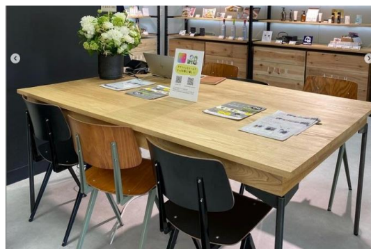
「いわての木があふれる空間づくり事業」を活用して導入された木製テーブル等