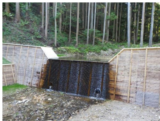
木製残存型砕工法による治山ダム (盛岡森林管理署)