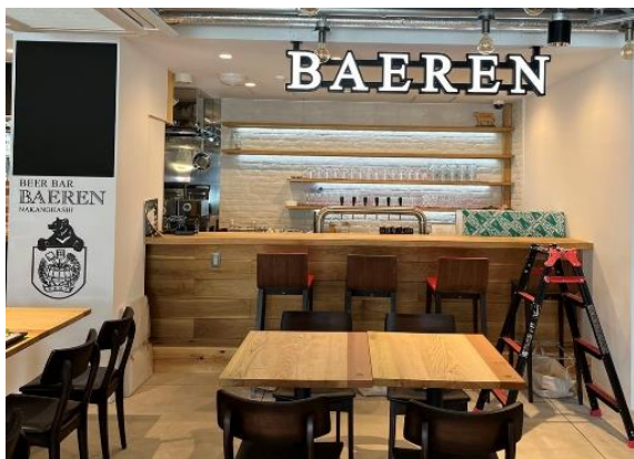
店舗への木製カウンター、棚の導入 （ベアレンクッチーナ(同)）