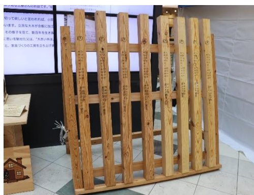
イベント等で県産カラマツ、アカマツのJAS製材品をPR