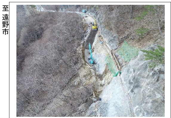
施工状況 金石側上空より