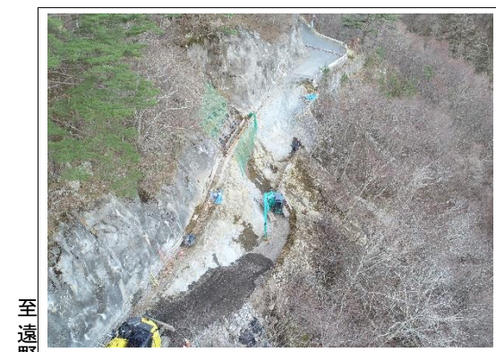
施工状況 遠野側上空より