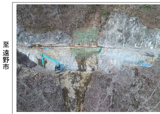
施工状況 谷側より