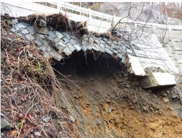
崩落状況(R2年4月時点)