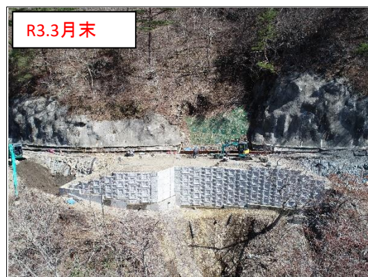
施工状況 谷側上空より(撮影:R3.3.31)