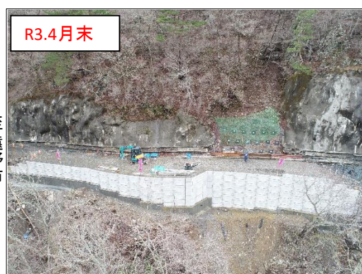
施工状況 谷側上空より(撮影:R3.4.30)