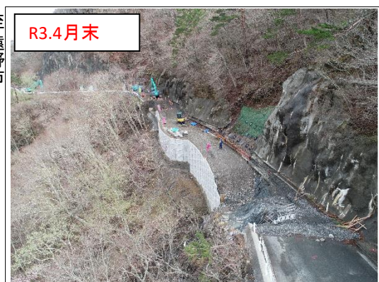
施工状況 金石側上空より(撮影:R3.4.30)