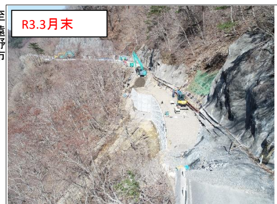
施工状況 金石側上空より(撮影:R3.3.31)