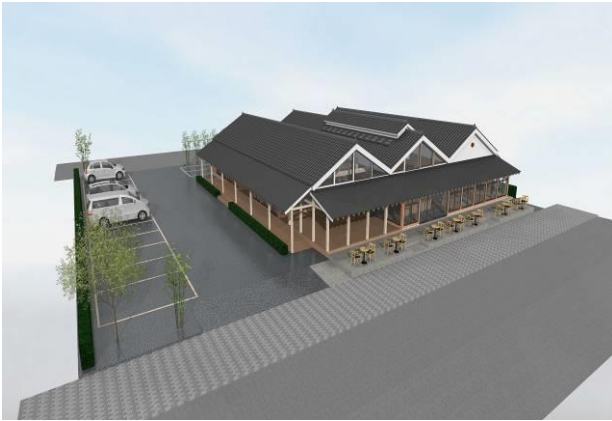
△発酵パークCAMOCY外観パース図

今回は、陸前高田市今泉地区に12月オープン予定の発酵パークCAMOCYを特集します。