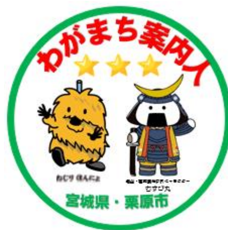
「わがまち案内人」バッジ（イメージ）