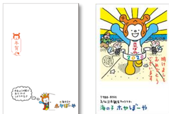
▲2020年1月に返信された年賀状

ホヤぼーやからは、年賀状をお送りいただいた方全員に「お返事年賀状」が送られます。そのデザインはその年のイメージ、干支に合わせて毎年違ったイラストが描かれていて、その年にしかもらうことのできない限定年賀状ですので、ぜひコレクションしてみませんか。