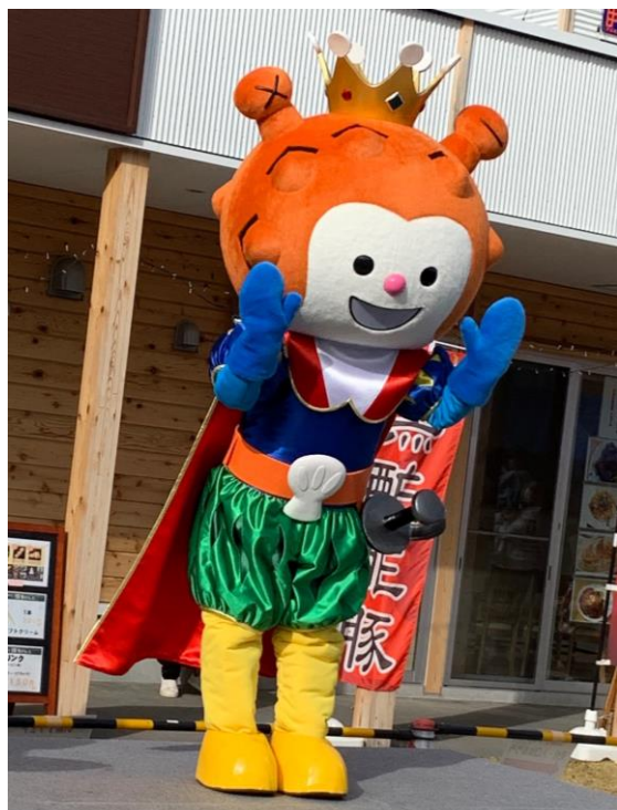
「海の子ホヤぼーや王子様コスチューム」

初お披露目された王子様コスチュームのホヤぼーやは、今後市内イベント等に登場予定です。イベントの開催が難しい状況が続いておりますが、出演が決定した際には、気仙沼市公式ホームページ内の「ホヤぼーや出張スケジュール」にて予定が掲載されます。ぜひご確認いただき、新しいコスチュームのホヤぼーやに会いに来てみてください。