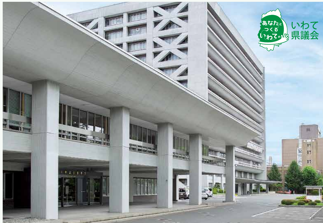
現在の議事堂（昭和40（1965）年～）

議事堂1階玄関ホールで県議会の歴史、議事堂の変遷、委員会活動の様子などのパネル展示を行っています。 どなたでも自由にご覧いただけます。 ◇月曜日～金曜日（土日祝日、年末年始を除く）