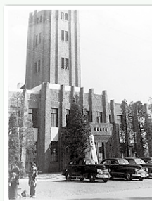
旧議事堂（現在の岩手県公会堂） 大正15（1926）年から39年間使用

（お問い合わせ）岩手県議会事務局 〒020-8570 岩手県盛岡市内丸10-1 FAX 019-629-6014 E-mail : gikai@pref.iwate.jp ホームページ https://www.pref.iwate.jp/gikai/