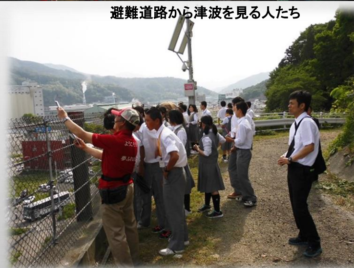
避難道路でのガイド