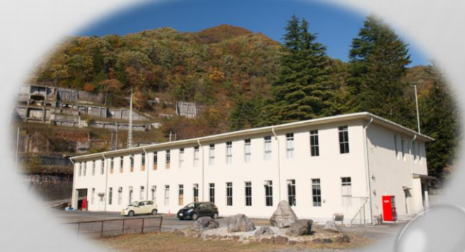
旧釜石鉱山事務所