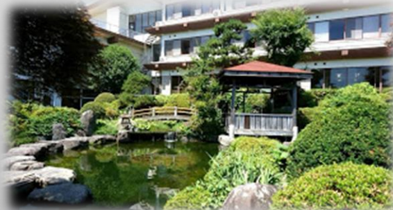
ホテルシーガリアマリン