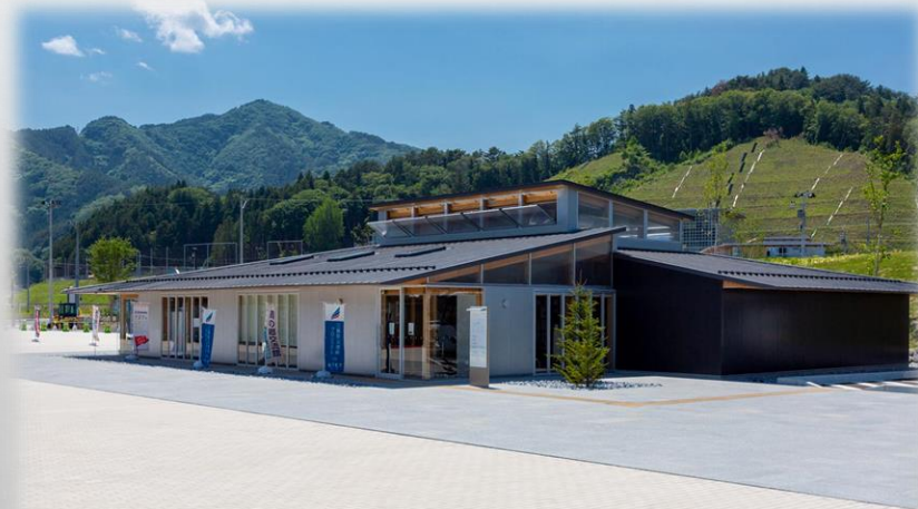
いのちをつなぐ未来館