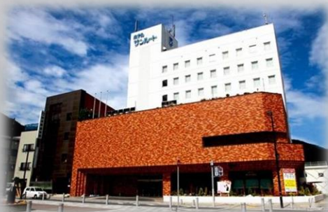
ホテルサンルート釜石