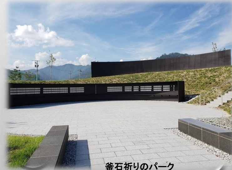
釜石祈りのパーク