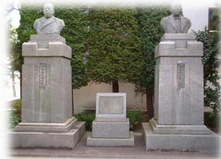
田中長兵衛・横山久太郎像