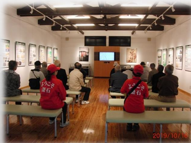
インフォメーションセンター(内部)