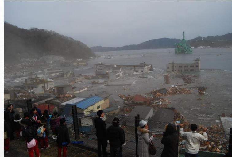
避難道路から津波を見る人たち