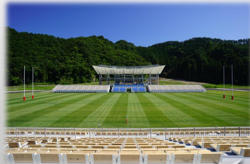
釜石鵜住居復興スタジアム