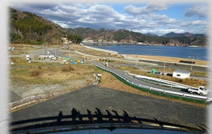
移転した根浜集落から海を望む