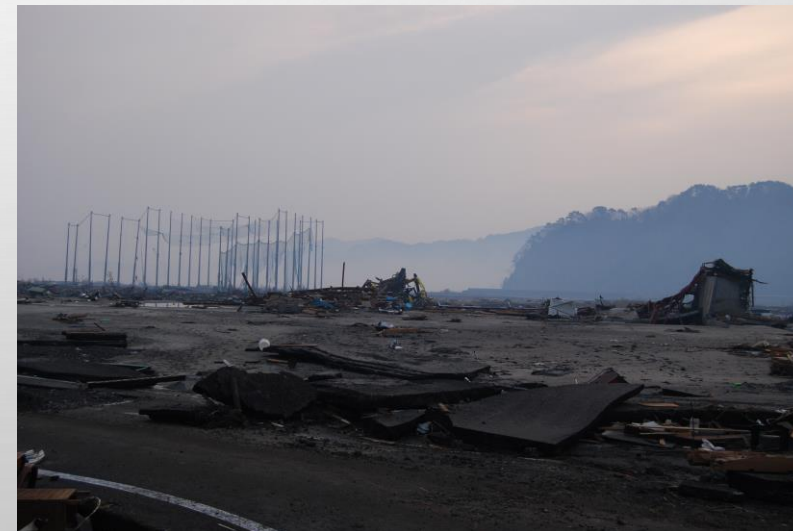
被災後の鵜住居方面