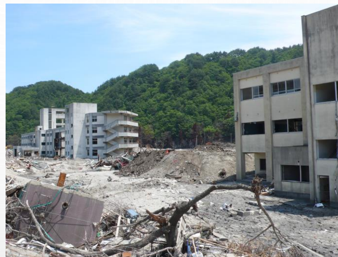
被災後の東中と(左)、鵜住居小