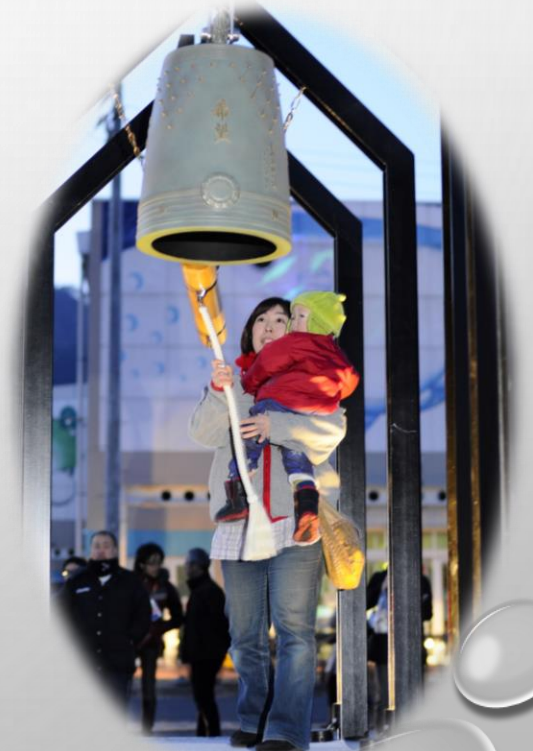
復興の鐘(釜石駅前)