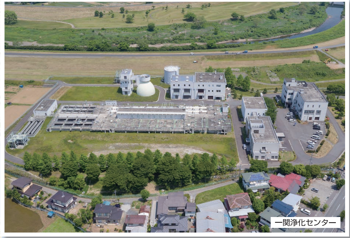
一関浄化センター