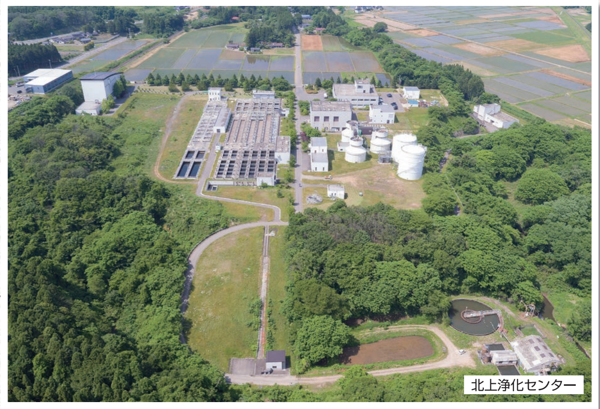
北上浄化センター