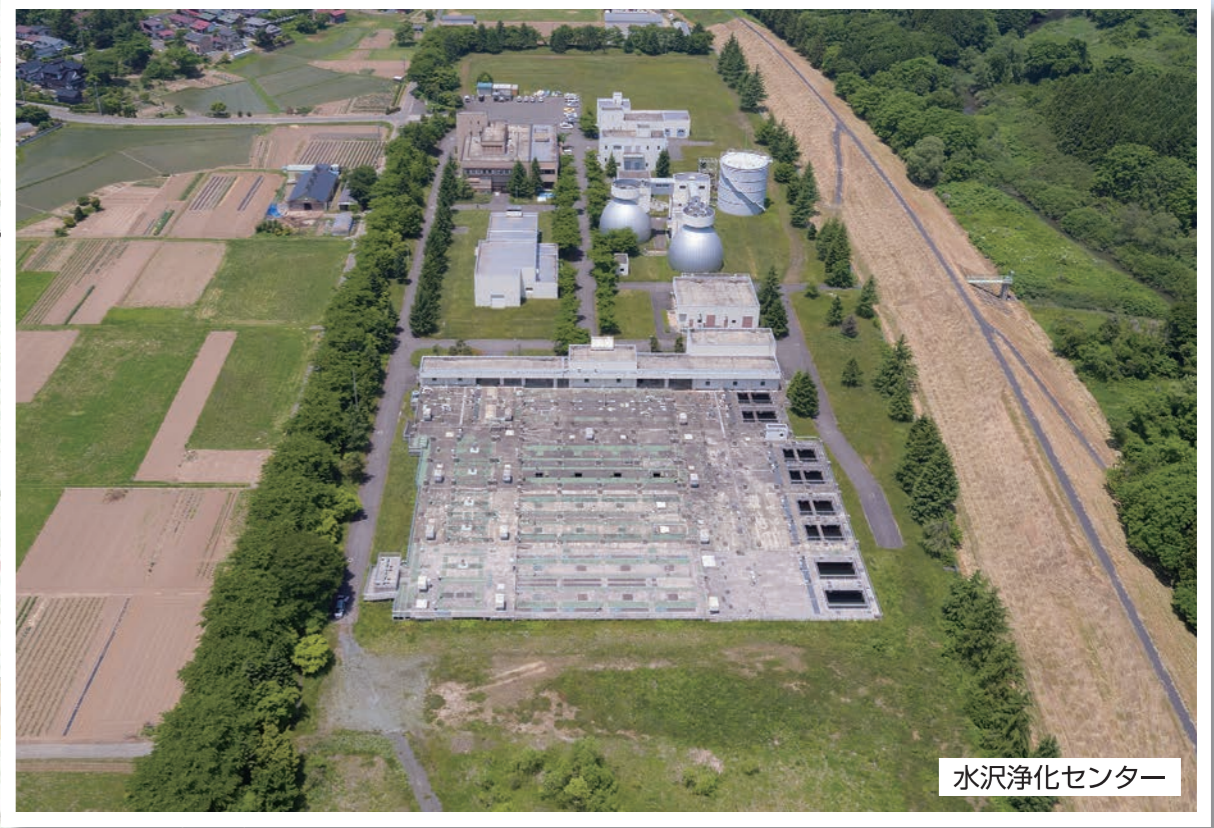
水沢浄化センター