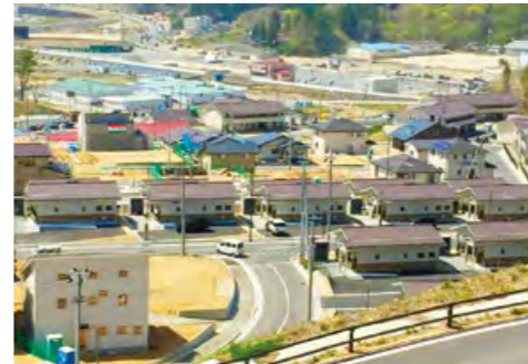
まちびらき後の田老地区 かさ上げや高台移転した土地で、住宅などの建設が進む。