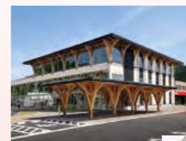
おしゃつち開館 町中心部に誕生した、図書館や交流施設を備えた複合施設。地域の憩いの場に。