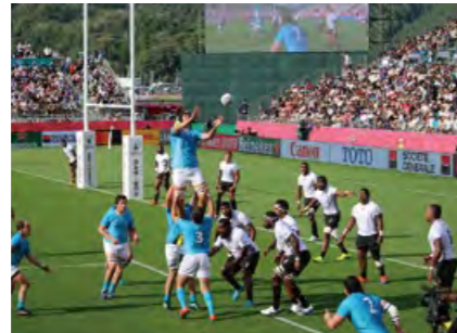
ラグビーワールドカップ2019™開催 旧鵜住居小学校・旧釜石東中学校跡地に整備されたスタジアムで、約14,000人がフィジー対ウルグアイ戦に熱狂。