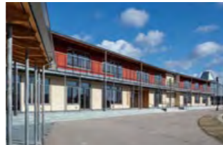
全被災公立学校再建 気仙小学校(陸前高田市、写真)の完成で、全ての学び舎が再生。