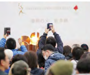
復興の火展示 東京2020オリンピック競技大会の聖火リレーに先立ち、聖火が「復興の火」として岩手に到着。