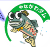
【築川ダム建設事務所 位置図】

4月1日以降の築川ダムに関する 業務については、盛岡広域振興局 土木部が担当します。