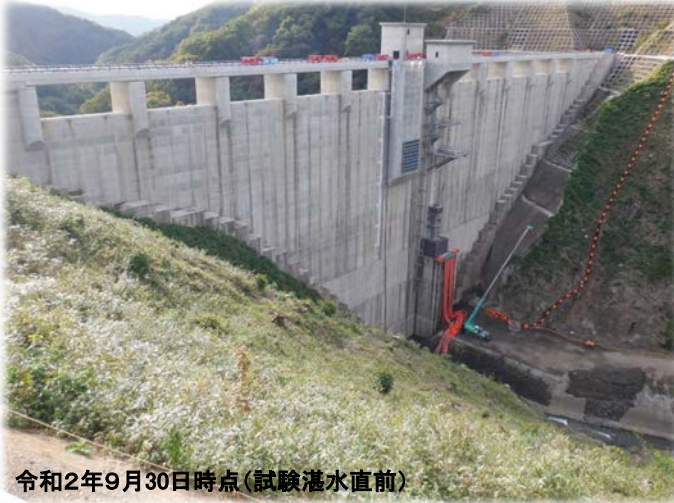
令和2年9月30日時点 (試験湛水直前)

築川ダムでは、令和2年10月2日より、試験的に貯水池内に水を貯めて、ダム本体及び貯水池周辺の斜面等の安全性を確認する「試験湛水」を行っています。