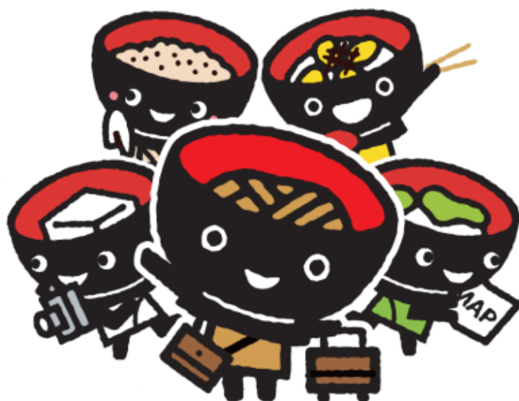
岩手県PRキャラクター「わんこきょうだい」

「観光入込客統計に関する共通基準」 に基づく統計量推計結果 (令和2年7月～9月・暫定値)