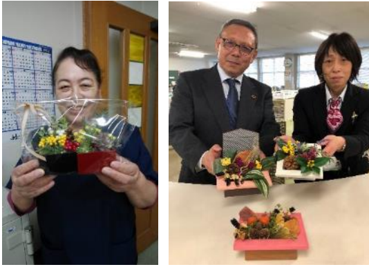
ドライフラワーを配布