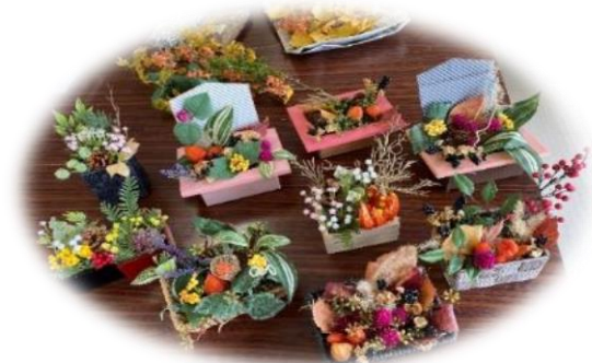
アレンジメント試作品