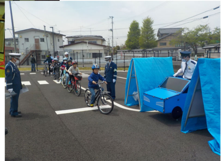
岩手県自転車条例 周知用ポスター (担当：復興防災部 消防安全課)