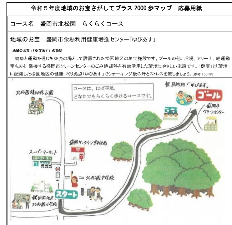
地域のお宝を巡るウォーキング(サイクリング)マップの作成