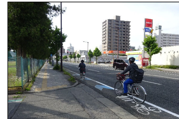
供用状況(主)盛岡横手線