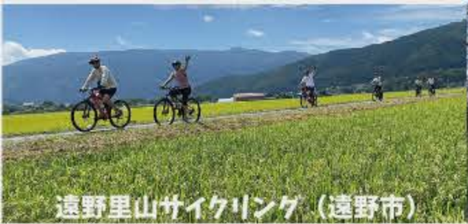
遠野里山サイクリング (遠野市)