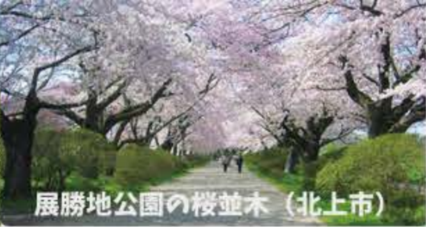
展勝地公園の桜並木 (北上市)