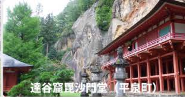
達谷窟毘沙門堂 (平泉町)