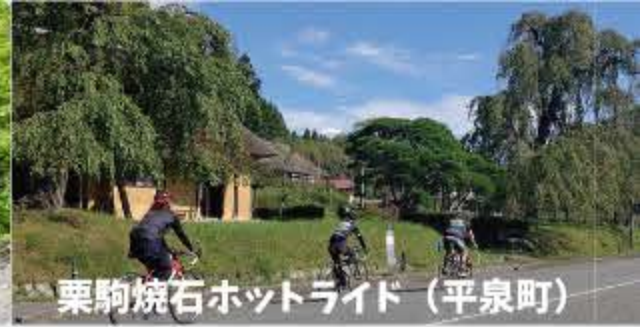
栗駒焼石ホットライト (平泉町)