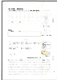
書写（硬筆）の規定応募用紙の例 （2021年度小学1年生向け課題）