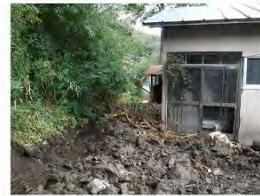
流出した土石が家屋まで到達し、家屋の一部が埋塞している