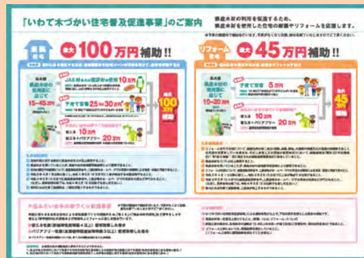
補助制度 PR パンフレット（一部抜粋）

省エネルギー住宅は、快適性や経済性に優れ、住宅一戸あたりから排出される CO2 が削減されることから地球温暖化対策にも有効です。