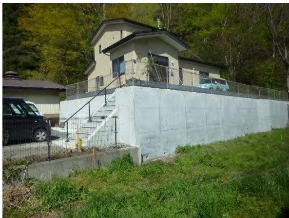
宅地を嵩上げて再建された住宅