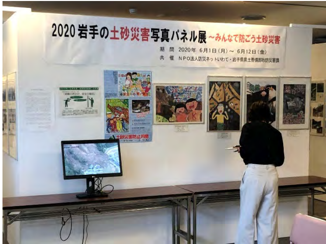
※写真は昨年度のもので

『土砂災害写真パネル展』では、 県内外で発生した土砂災害や防災関係機関の取組 等を紹介するパネルや、 土砂災害の映像上映 、昨年度に 小中学生から募集した「土砂災害防止に関する絵画・作文」 の優秀作品を展示する予定なので、ぜひご覧ください。