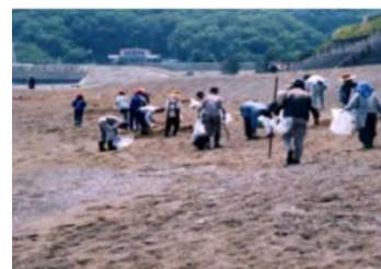
写真 ボランティア団体による活動