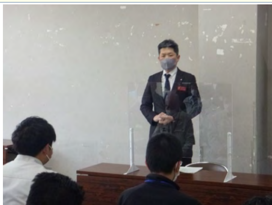
思いを熱く語る中平県土整備部長