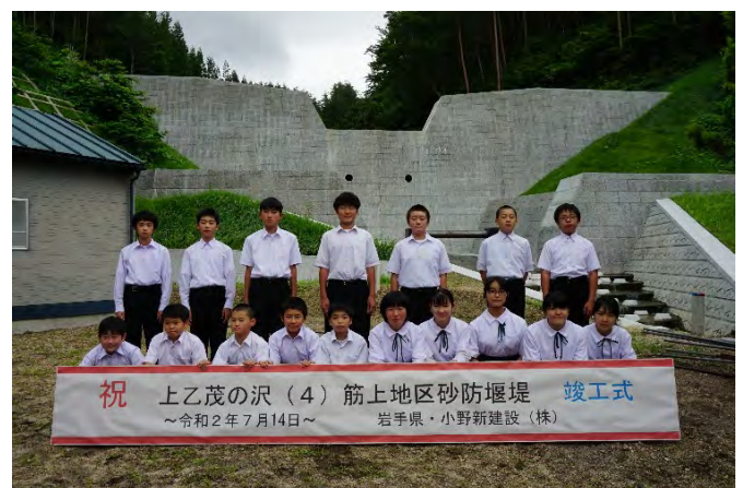
砂防堰堤竣工式(令和2年7月開催)