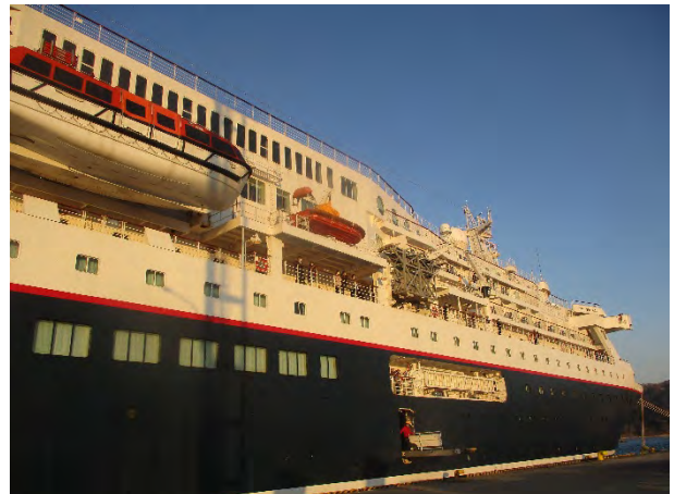
↑ 離岸間際の「にっぽん丸」