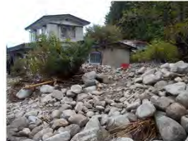
沢から流出した巨石が人家まで到達している