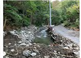
沢から流出した土石流が、沢を横断するように堆積している