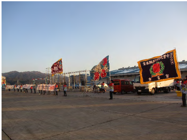
↑ 大漁旗を掲げて見送る関係者

寄港した旅客は、雫石町をめぐるツアーや浄土ヶ浜をめぐるツアーを楽しみ、18時ごろ青森県に向けて出航しました。