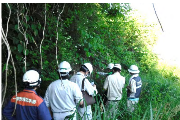
(一関土木センター管内)

国・市町村・砂防ボランティア岩手県協会などの関係機関と連携して、土砂災害危険箇所の点検を実施します。また、砂防施設の点検を行い、施設に変状等が無いかを確認します。