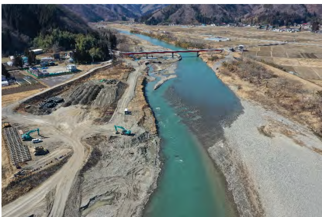
河川改修が進んでいる小本川