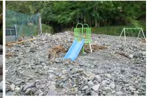
人家近傍の公園に土石が流入している