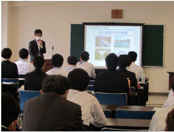
【県土整備行政の概要】