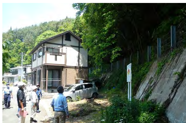
(花巻土木センター管内)