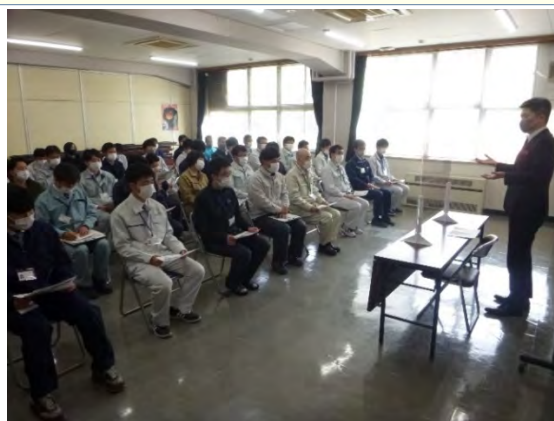
部長の思いを熱心に聞く職員