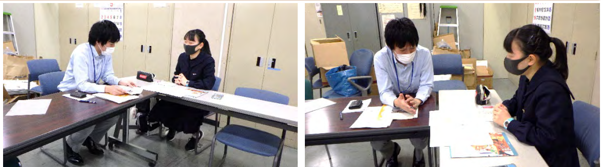
総合学習対応の様子（説明を真剣に聞く花巻北高校生徒）

来庁した花巻北高校生徒は、ご自身の進路について建築学科を志望しているとのことで、住宅の省エネルギー化について、担当者の説明を真剣に聞いていました。