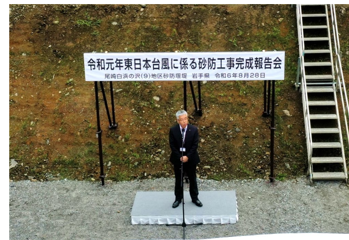
沿岸広域振興局土木部長挨拶