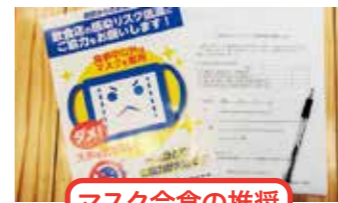
マスク会食の推奨