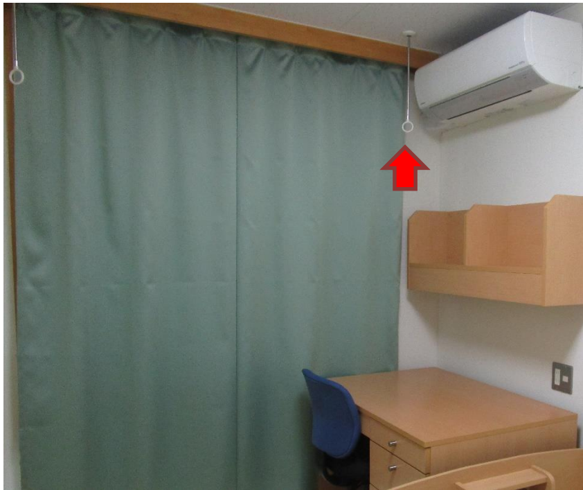
部屋干しできるフック 2個(竿なし)