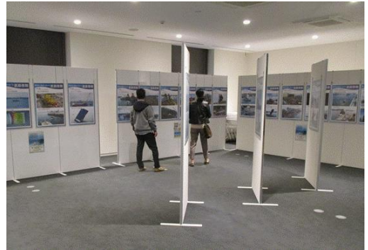
パネル展「東日本大震災における航路啓開」